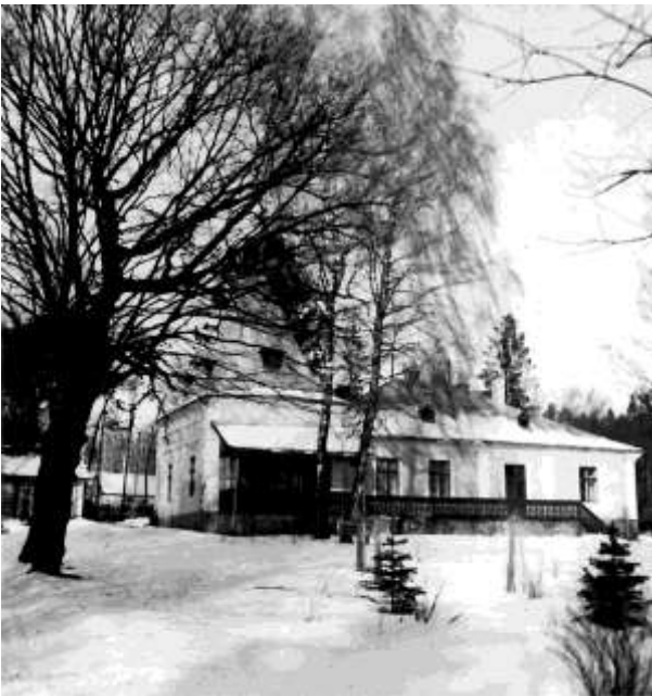
Der Gutshof der Schofer in Zielow

Aufgrund des deutsch-sowjetischen Grenz- und Freundschaftsvertrages besetzten die Russen im September 1939 den Ostteil Polens. Für die dort ansässigen Galiziendeutschen bedeutete das, dass sie das Land, das heute zur Ukraine gehört, verlassen mussten.